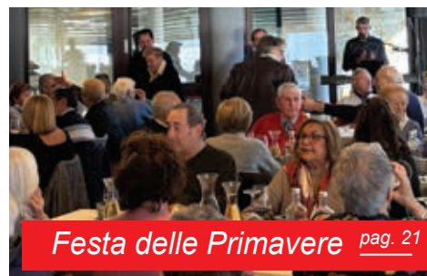
Festa delle Primavera pag. 21