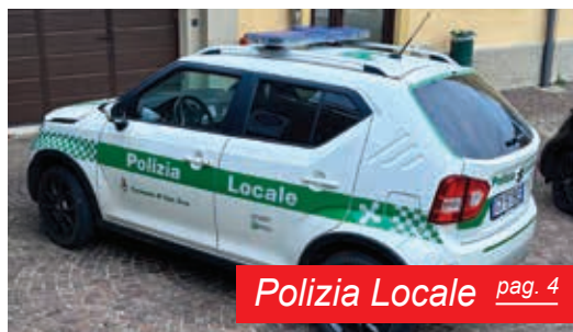
Polizia Locale pag. 4

Con stima e affetto Il Sindaco, Nicola Mappa