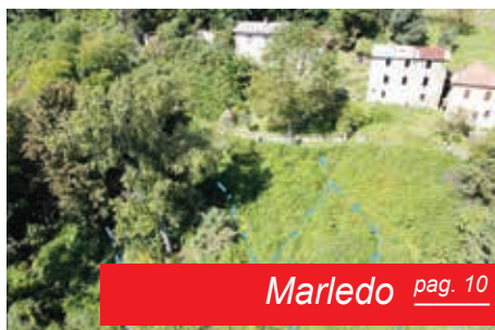
Marledo pag. 10